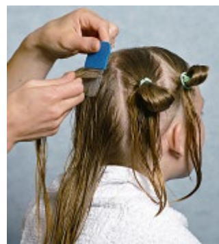
1 Щоб виявити воші на довгому волоссі, бажано розділити волосся на 3-6 хвостиків і розчісувати по одному.