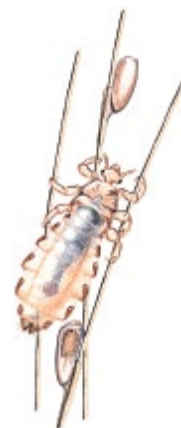
2 Яйця вошей міцно прикріплені до волосся.

Дотримуйтесь інструкцій щодо використання, вказаних на продукті. Пам'ятайте, що лікувати слід лише тих, у яких є воші, оскільки завжди існує невеликий ризик побічних ефектів.